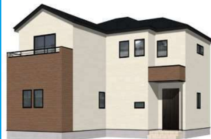
1号棟完成イメージ (現況と異なる場合がございます)

土地面積：146.51㎡ (約44.31坪) 建物面積：106.81㎡ (約32.30坪) 建築確認番号：第R06SHC100337号