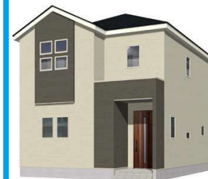
2号棟完成イメージ (現況と異なる場合がございます)

土地面積：162.53㎡ (約49.16坪) 建物面積：107.83㎡ (約32.61坪) 建築確認番号：第R06SHC100338号