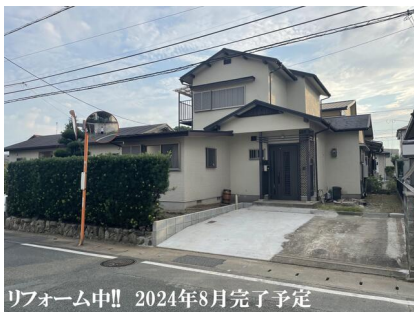
リフォーム中!! 2024年8月完了予定