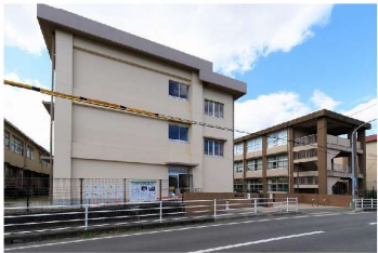
託麻東小学校 …徒歩17分

※物件場所詳細につきましてはホームページ確認または店舗までお気軽にお問合せ下さい。