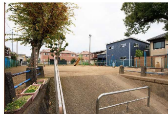
葉山南公園 …徒歩2分

※徒歩分数は80m=1分、車分数は333m=1分で計算（端数は切り上げ）しています。