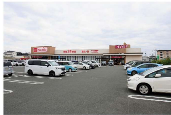
マックスバリュ 新戸島店…徒歩10分