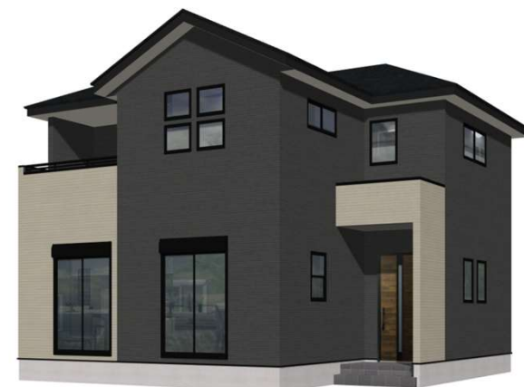
7号棟完成イメージ