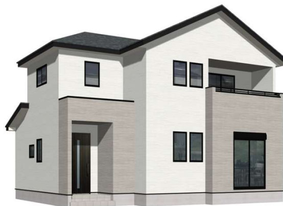
3号棟完成イメージ