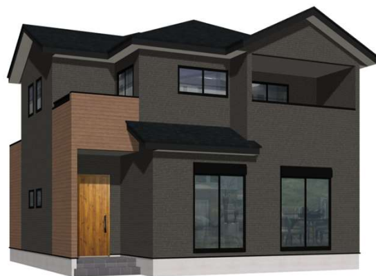
1号棟完成イメージ